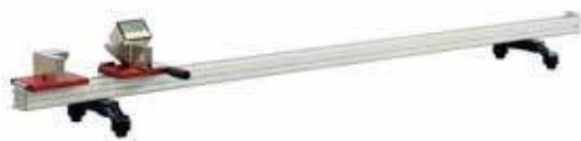
DLG 100 - DLG 200 - DLG 300 - DLG 550 Dijital boy ölçme cihazı DLG 100 - DLG 200 - DLG 300 - DLG 550 Digital length gauge Устройство для измерения длины профиля DLG 100 - DLG 200 - DLG 300 - DLG 550