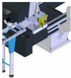
Kısa profil kesme sistemi Short cut system Упор для установки длины профиля